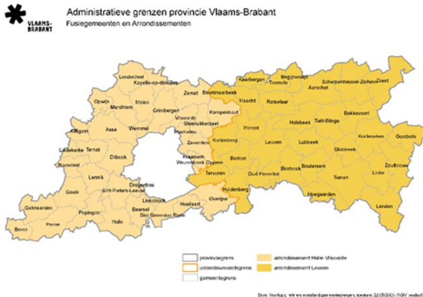
Afbeelding 1: Arrondissementen Vlaams-Brabant

In het belang van het onderzoek bakenen we de speelpleinwerkingen in Vlaanderen territoriaal af. Hierbij wordt de provincie Vlaams-Brabant onderverdeeld in twee arrondissementen: Halle-Vilvoorde en Leuven. Zie afbeelding 1 (Provincie Vlaams-Brabant, 2019) Binnen deze twee zijn er 65 gemeenten. (Vlaams-Brabant, 2019) De speelpleinwerkingen van deze gemeentes worden verdeeld in 62 gemeentelijke speelpleinen, 19 niet-gemeentelijke speelpleinen en 2 buurtwerkingen. (Fien Smet, 2019)